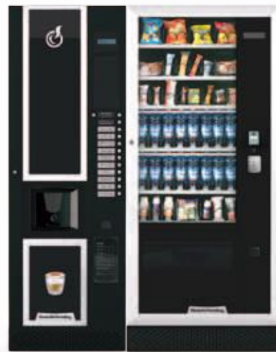
LEI600 + ARIA L MASTER