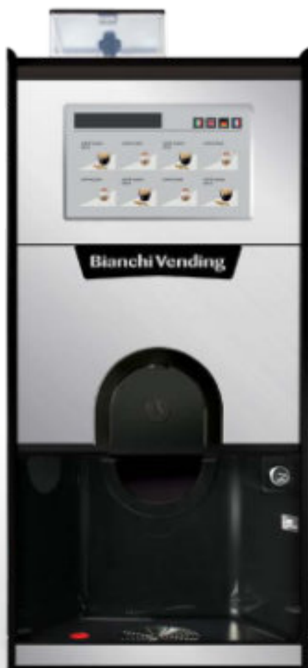
GAIA t ou CH

GAIA styleLE, máquina semi-automática de bebidas quentes, disponível tanto em café expresso a partir de grão de café como também em versão de bebidas solúveis.