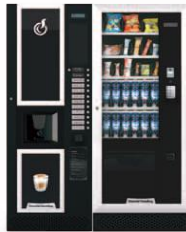
LEI400 + ARIA M MASTER